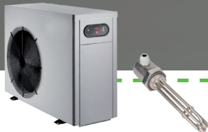
Geräte und Anlagen, Heizelemente